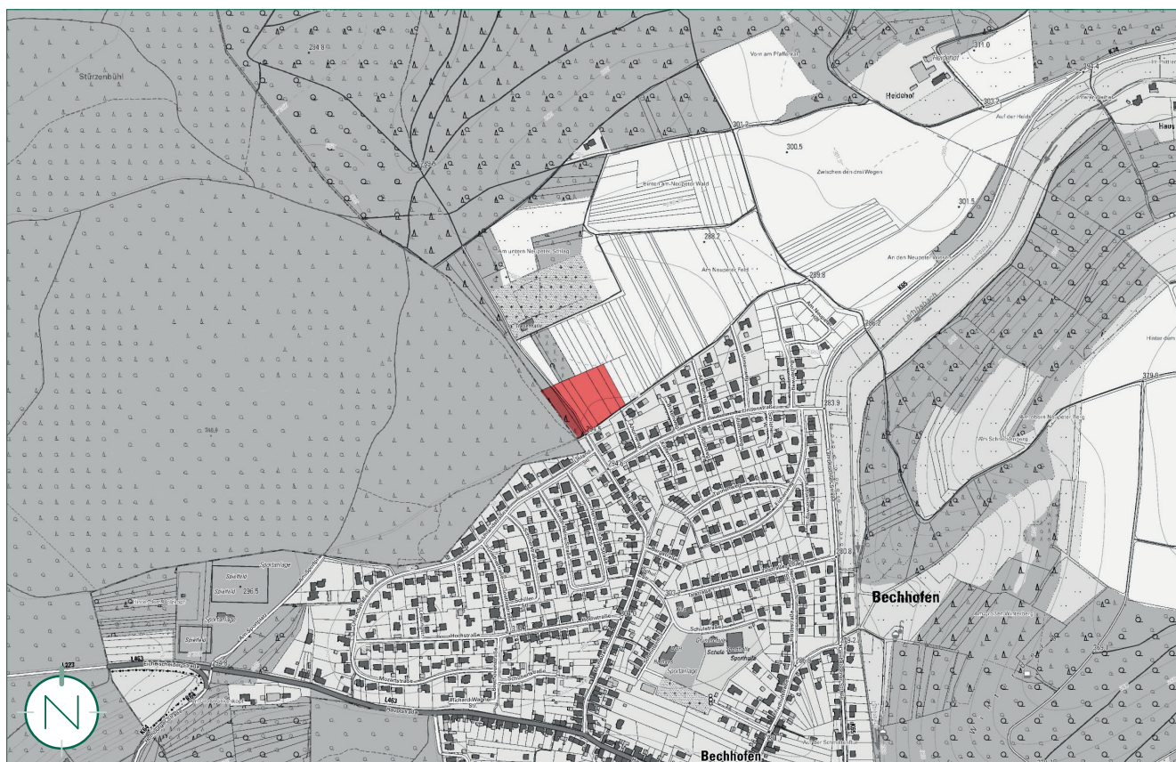
Übersichtsplan mit Geltungsbereich (rot); ohne Maßstab

Die Römerhaus Bauträger GmbH hat bei ihrer internen Bedarfsplanung 140 Plätze ermittelt. Zusammen mit der Ortsgemeinde Bechhofen wurden verschiedene verfügbare Standorte geprüft, die auch die notwendige Größenordnung erfüllen. Neben dem jetzt zu überplanenden Standort wäre noch der Standort am Dorfgemeinschaftshaus in Frage gekommen, wobei nach Abwägung die-