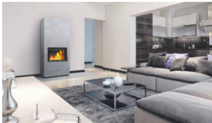
Die neuen Pielinen-Modelle sind schlichte und zugleich hochmoderne Heizkamine. Für die Oberflächengestaltung stehen diverse unterschiedliche Designs zur Auswahl.

Die aktuellen Modelle sind trotz ihrer kompakten Abmessungen wahre Kraftpakete, sodass sie auch für Wohnräume mit begrenztem Platz eine tolle Lösung sind. Die Modellvarianten sind im Fachhandel in unterschiedlichen Höhen und verschiedensten attraktiven Specksteinoberflächen erhältlich. Die teils mehrdimensionalen Oberflächen (reichen von glatt bis rau) heben die Schönheit des Natursteins hervor und bringen nordisches Flair in die eigenen vier Wände. Auch beim Blick auf die Flammen sind Varianten möglich. So ist der Einbau der Glasscheibe waagrecht, senkrecht und sogar über Eck umsetzbar. Wer die attraktive Wärmequelle als Blickfang mitten im Raum platziert, kann bei einer so genannten Tunnelversion das Flackern des Feuers gleich von zwei Seiten aus betrachten. Ein toller Effekt.