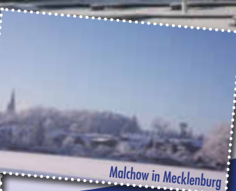
Malchow in Mecklenburg

Tel: 039932-825201 · info@ferienkontor-mv.de stadthafen-malchow.com