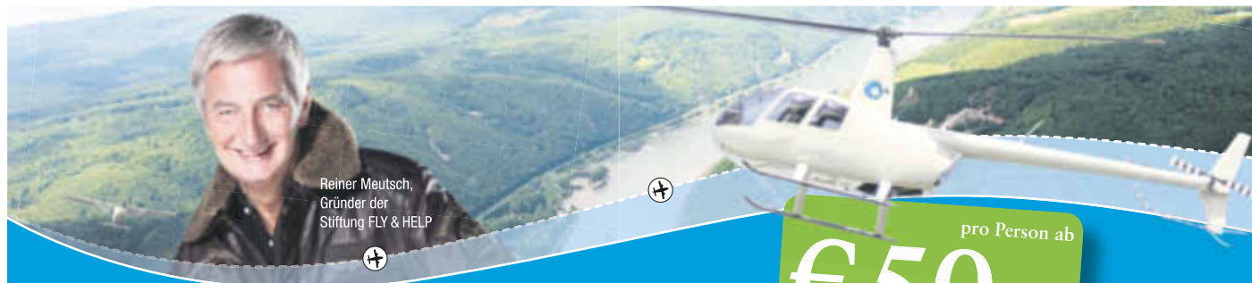
Reiner Meutsch, Gründer der Stiftung FLY & HELP