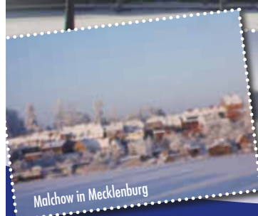
Malchow in Mecklenburg