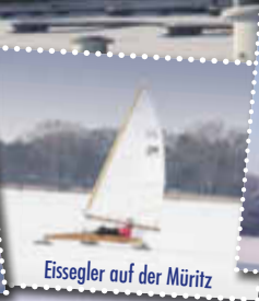
Eissegler auf der Müritz