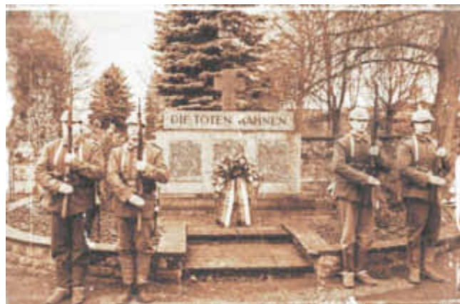
Gefallenenehrenmal Bechhofen, Foto: Merker

Liebe Mitbürgerinnen und Mitbürger, am Sonntag, den 18. November 2018, 11:00 Uhr, findet anlässlich des Volkstrauertages im Dorfgemeinschaftshaus eine Gedenkfeier mit anschließender Kranzniederlegung am Gefallenenehrenmal statt. Mitwirkende sind Volkschor, Musikverein St. Michael, Freiwillige Feuerwehr und die Darstellungsgruppe Süddeutsches Militär 1870-1918.