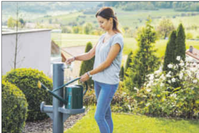
Praktischer Flachtank im Boden versteckt: Zur Wasserentnahme lässt sich entweder ein Schlauch anschließen oder direkt über den Wasserhahn eine Gießkanne befüllen. Die kann dazu bequem auf der dafür vorgesehenen Vorrichtung abgestellt werden.

Liter Wasser aus dem öffentlichen Netz, ohne über die Kosten nachzudenken. Dabei lässt sich besonders viel sparen, indem die Pflanzen mit Regenwasser versorgt werden. Es kommt schließlich kostenlos vom Himmel – und gleichzeitig der Umwelt zugute.