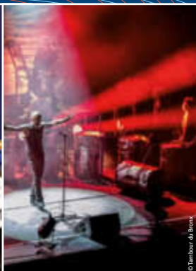
Les Tambours du Bronx