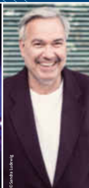
Stefan Gwildis & Julia Neigel