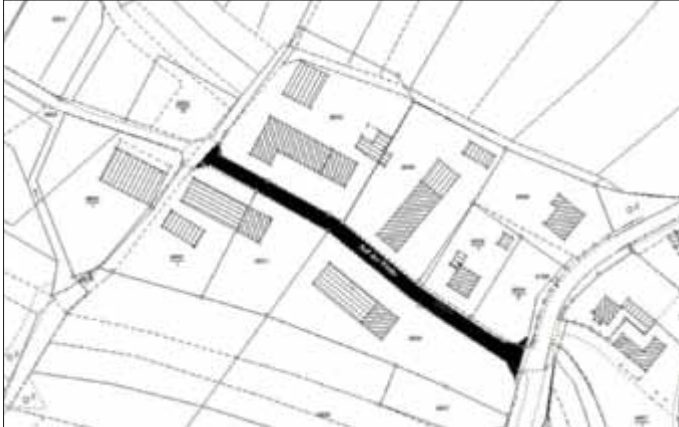
Denkmalstraße: Flurstück Plannummer 980 auf einer Länge von 95 m ab der Einmündung Turnhallstraße

Plannummer 5127/1 auf einer Länge von 165 m bis zur Einmündung des kreuzenden Wirtschaftsweges