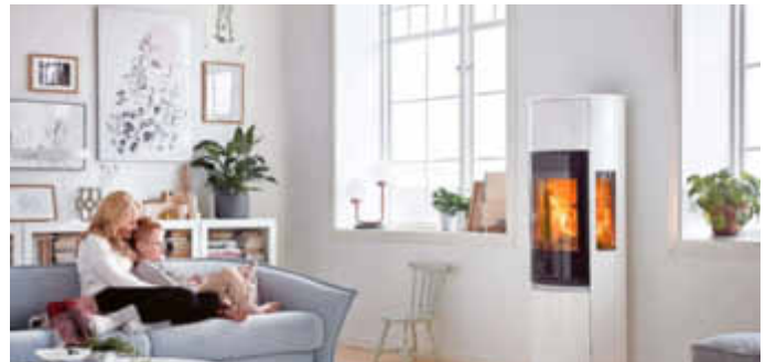
Beliebtes Design: Seitenscheiben ermöglichen bei diesem Kaminofen den Blick auf das Feuerspiel aus jedem Winkel. Das sorgt für eine wunderschöne Atmosphäre – am Tag ebenso wie in der Dämmerung oder am Abend.

sich oftmals auch bis über die Seiten, so kann das so nützliche und gleichzeitig auch noch romantische Feuerspiel aus jedem Sichtwinkel des entsprechenden Raums genossen werden. Schnell kommt so eine bessere Stimmung auf, denn das Flackern hat auch eine erstaunlich beruhigende Wirkung auf uns. Mehr zu den Kaminöfen-Neuheiten sowie zu den klassischen Modellen gibts bei den Profis in den örtlichen Fachgeschäften. Die sind bestens bestückt, haben für jeden Geldbeutel und Geschmack das passende Teil zur Hand.