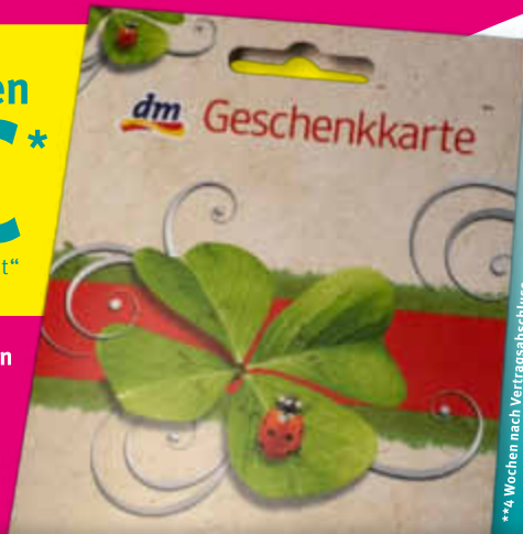
**4 Wochen nach Vertragsabschluss